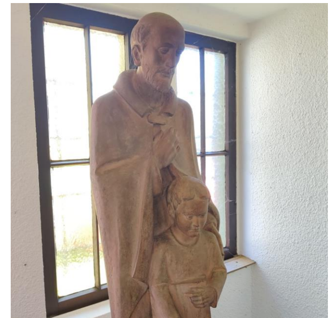
Josef mit Jesus (Hettenhainer Kirche).